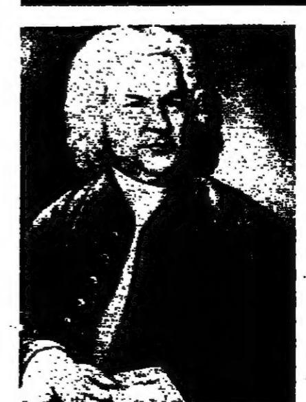
الهايتا تميمي باغ